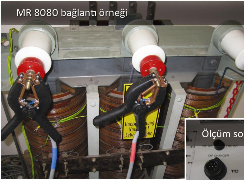
Ölçüm sonuçları örneği